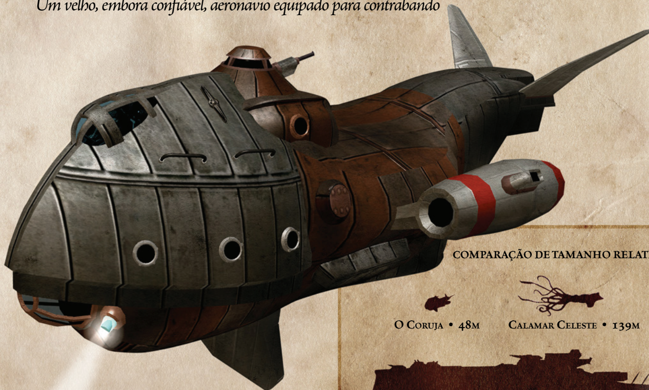
COMPARAÇÃO DE TAMANHO RELATIVA

Um velho, embora confiável, aeronavio equipado para contrabando